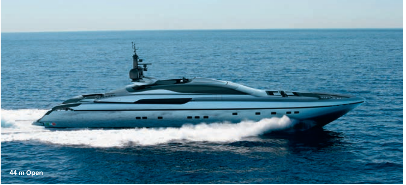
44 m Open