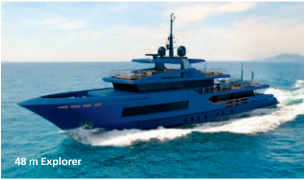
48 m Explorer